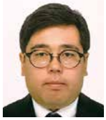
あらわ 川 翼

● 会社名 葦陽薬品株式会社 会社住所 福山市西深津町4-5-20 業種 卸売業・小売業