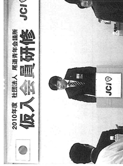
手塚理事長予定者は挨拶の中で、2011年度の理事長としての思いを仮入会員に伝えました。