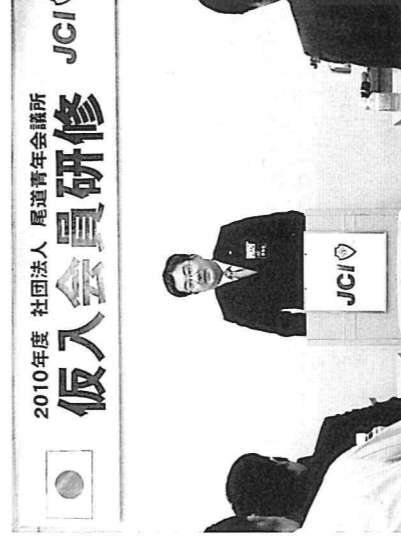
鍛冶川理事長の挨拶では、仮入会員に対してJCI CEEとしての心構えについてお話されました。