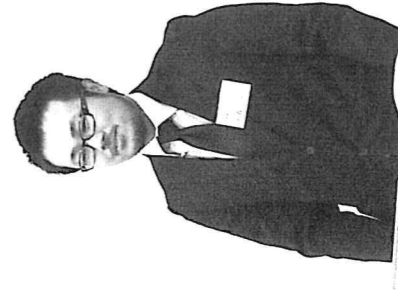
3分間スピーチを体験。皆さん3分を有効に使いスピーチを發表してまいりました。