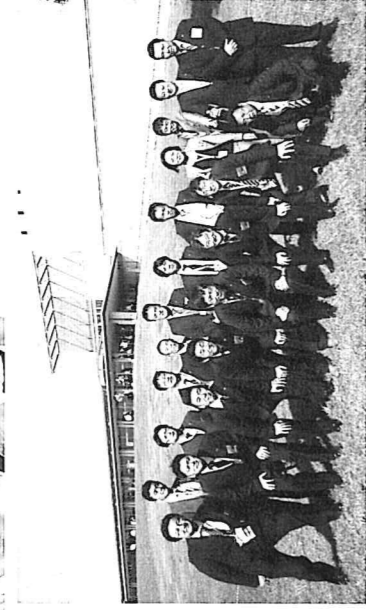
全国大会の会場、小田原アリーナ前で記念撮影。総勢21名が参加してまりました。