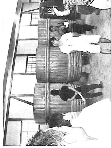
竹原の竹鶴酒造にて、伝統ある酒造りへのこだわりと現代のニーズに対応した経営戦略を学びました。