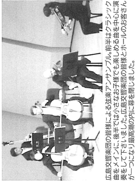
広島交響楽団の皆様による弦楽アンサンブル。前半はクラシック曲をメインに、後半では小さなお子様でも楽しめる曲を中心に演奏をして下さいました。広島交響楽団の皆様とホールのお客さんが一つになり最高潮の内に幕を閉じました。

最後になりましたが、メンバー皆様のご協力により拡大アンケートは無事全員に回答して頂きました。また、なにより例会100%出席を達成できたことを心より感謝いたします。本当にご協力ありがとうございました。今後も拡大活動のご協力よろしくお願ひ致します。