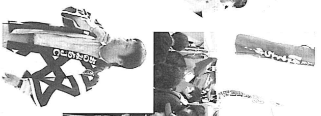
表彰式にて。優勝の栄冠は今治の焼豚玉子飯に輝きました。上位3店舗の皆様が、つばんグランプリの成功と輝かしい成績を讃えて笑顔で記念撮影。