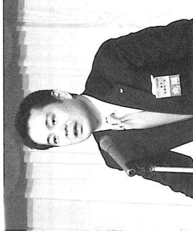
相澤会頭の講演。「広島ブロックの皆様に期待しています。」と熱くエールを送って下さいました。