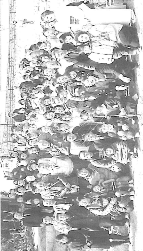
千光寺公園にて平谷市長、桜のオーナーの皆様、尾道市職員の皆様と共にJCIメンバーも記念撮影。中央の苗木は日本三大桜の一つ「淡墨桜」の子孫樹。