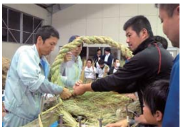
奉納に向けメンバー一丸となつて、気合いを入れて頑張っております。11月も延長して行つてまいりますので、皆様是非ご参加ください。

9月より毎週木曜日、旧尾道高校グラウンド内武道場にて行われていきます大わらぞうり改修事業ですが、10月からは一般のボランティアの皆様にも加わって頂き、毎回多くのメンバーが参加し和気あいあいと作業を進めております。 10月末までに中型のわらぞうり4足を製作いたしました。これからのよいよ大わらぞうり製作に取り掛かってまいります。進捗状況は折り返し地点を過ぎたところですが、榎原委員長率いる徳溢れる教育推進委員会の指揮の下、奉納に向けメンバー一丸となつて、気合いを入れて頑張っております。11月も延長して行つてまいりますので、皆様是非ご参加ください。 (記事・細木 豪)