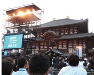
5日(土)は、なら100年会館にて開催されたメインフォーラム「勇壮なる日本へ」我々が目指す新しい時代」と、東大寺大仏殿にて開催された記念式典に参加いたしました。記念式典終了後は卒業式が行われ、尾道JCからも卒業予定者のメンバーが出席、メンバー全員から祝福を受けました。改めて参加されたメンバーの皆様、お疲れ様でした。 (記事・徳水 剛志)