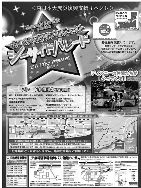
主催/実行委員会 ユニタ尾道青年会議所 社団法人尾道青年会議所 協力/尾道商工会議所 社団法人尾道観光協会 お問い合わせ/社団法人尾道青年会議所 TEL.0848-25-1110 第9期幹事 フェスタ尾道実行委員会 TEL.0848-25-7447 (平日のみ)

7月23日(土)、尾道新浜通りにて灯りプロジェクト「おのみちシーサイドパレード」が開催されます。本イベントは東日本大震災復興支援イベントであり、募金ブースを設置しております。復興支援に向けて今被災地がどのような状況で何が必要なのかという認識を深めるため、本イベントを担当される夢のまち創造委員会のメンバーの方々が実際に福島県相馬市に行つて来られましたので、そのレポートをいただきました。