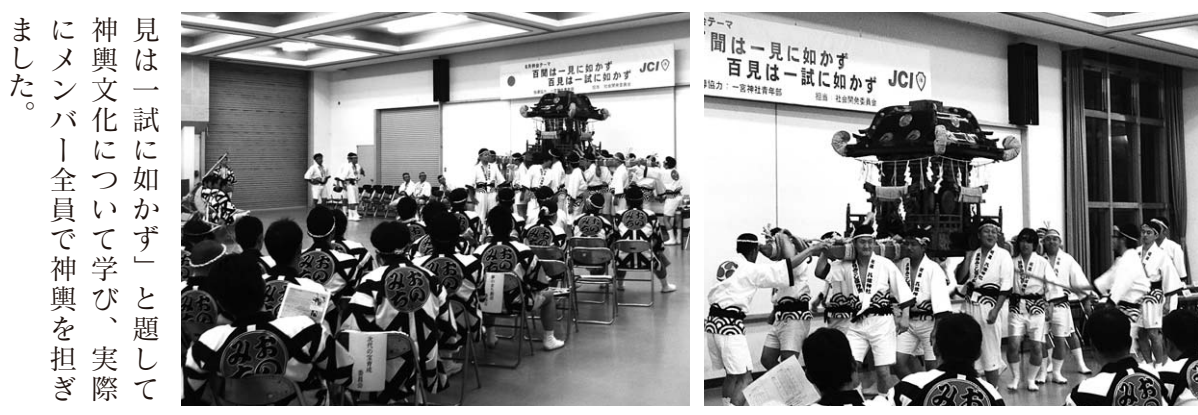
見は一試に如かず」と題して神輿文化について学び、実際にメンバー全員で神輿を担ぎました。